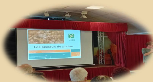
Conférence d'Indre nature