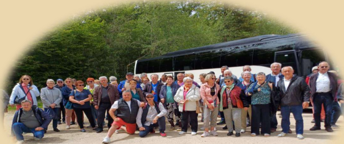
Voyage des jardiniers