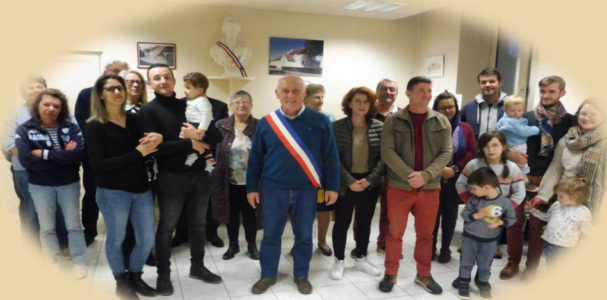
Accueil des nouveaux arrivants