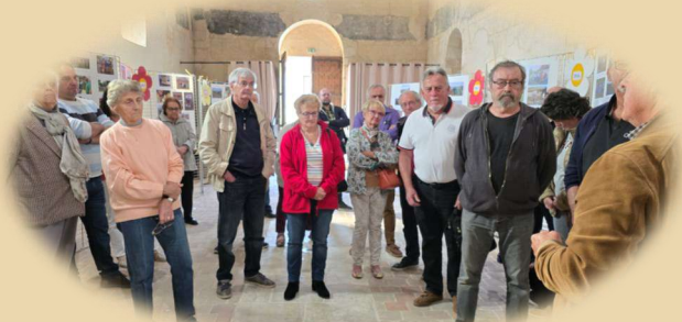
Exposition des 10 ans des jardiniers