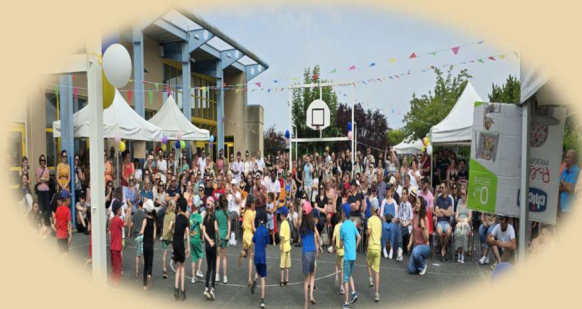
La kermesse de l'école