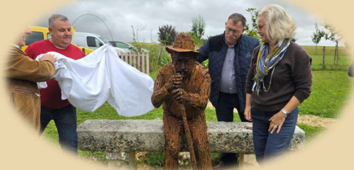
Inauguration de la statue du père «Vinbon »