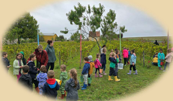
Les enfants en vendanges