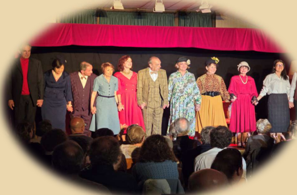
Soirée théâtre avec la compagnie de la vieille prison