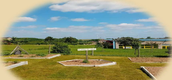
Le renouveau du potager des enfants