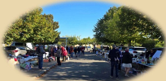
La brocante du comité des fêtes