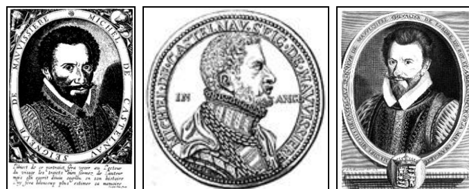
Michel de Castelnau